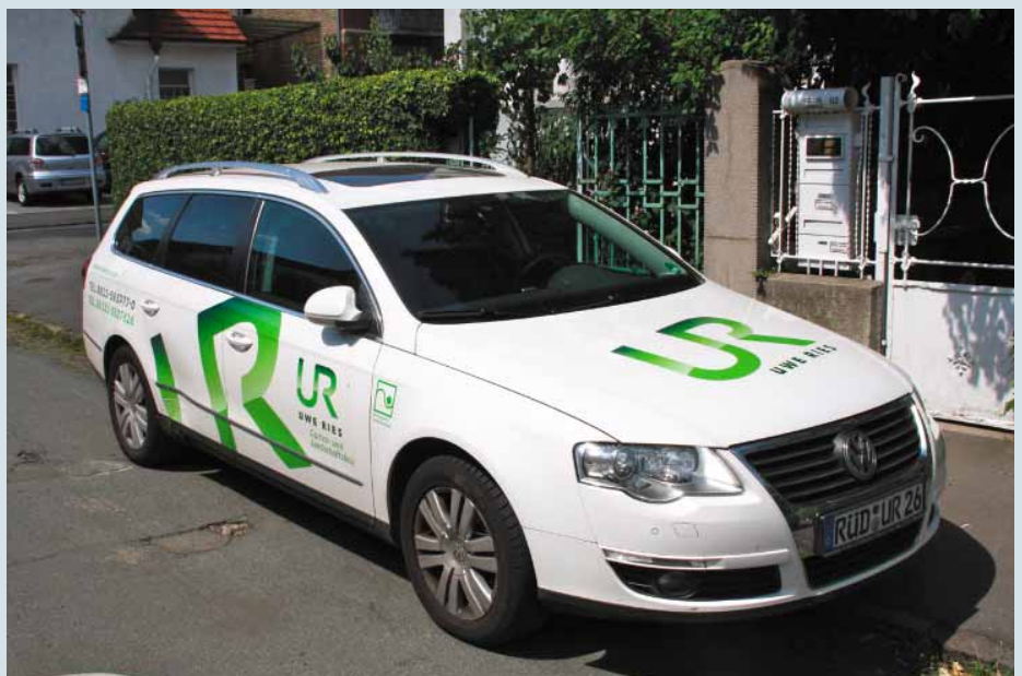
Farben umgekehrt: Sämtliche Fahrzeuge der Firma Uwe Ries in weiß tragen das Logo in unterschiedlichen Grüntönen.

auf maximal ca. 1 MB komprimiert werden, egal wie groß sie sind. Kommt es zum Auftrag, sind die Bilder auch für die ausführende Kolonne sehr hilfreich, weil sie sofort erkennen kann, um was es geht.