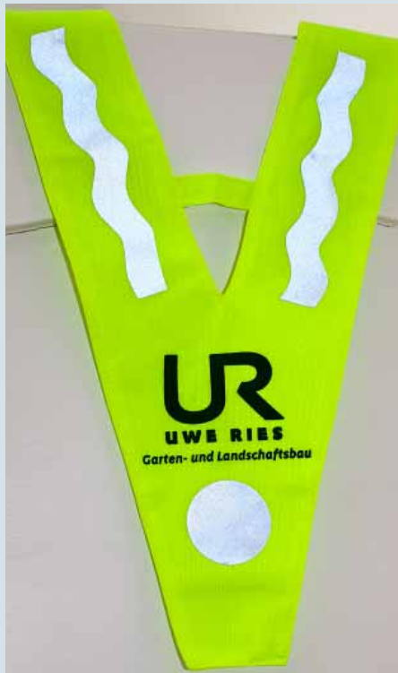
Sozial engagiert: 95 solcher „Sicherheitsüberwürfe“ sponserte der Betrieb für Schulanfänger an der Maler-Becker-Schule in Mainz.

Der Quereinsteiger setzte von Anfang an auf Kundenorientierung, Mitarbeiterbindung und Prozessoptimierung durch den konsequenten Einsatz der Branchensoftware der Firma KS21. „Wir haben als einer der ersten Kunden die Vollversion von GaLaOffice angeschafft, mit dem Ziel uns bei der Organisation unseres Betriebes langfristig entwickeln zu können. Inzwischen hat sich das Software-Paket mehrfach bezahlt gemacht. Auch der Übergang zu