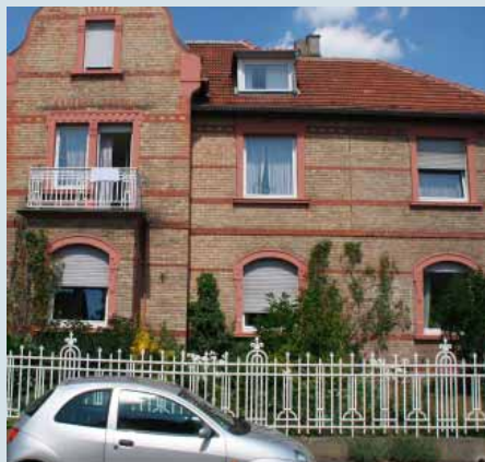
Gelungener Wechsel: Mit der Eröffnung des Büros in Mainz-Gonsenheim kam der Durchbruch.